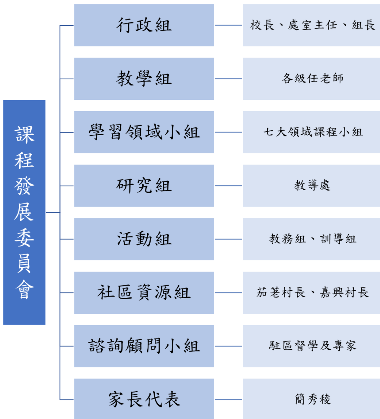
附件一 課程發展委員會組織表